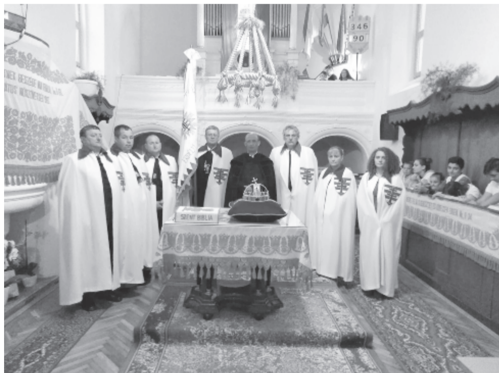
A lovagi rend is megtisztelte a szombati rendezvényt

aki régi kapcsolatokat ápol az anyaországiakkal. Az eseményt megtisztelte jelenlétével a Szent László Társaság (1861) és Rend erdélyi tagsága, valamint a Történelmi Vitézi Rend két tagja is. Az ünnepi alkalomra délután került sor a templomban, ahová a Szent László-apródok és lovagok bevonulását követően és a himnusz éneklése közben hozták be a korona mását. Az áhítat alatt a két rend zászlajával tisztelegtek, majd a köszöntések után Tóth István beszélt a Szent Korona történetéről, jellegzetességeiről, de arra is kitért, hogy mit jelent a korona a nemzet számára: a magyar államalapítást, a kereszténység felvételét. Azóta is a Szent István által lerakott alapokra épül fel a magyar állam intézményrendszere és a fiatalok értékkeresése. Ezt az