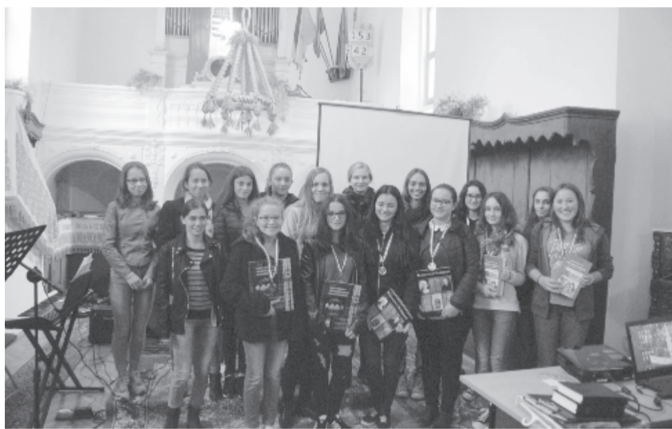
Az egyházmegyei ifjúsági nap is sikeresnek, hasznosnak bizonyult

eszmiséget tovább kell vinni, mert mint közösség csak így tudunk megerősödni a Kárpát-medencében.